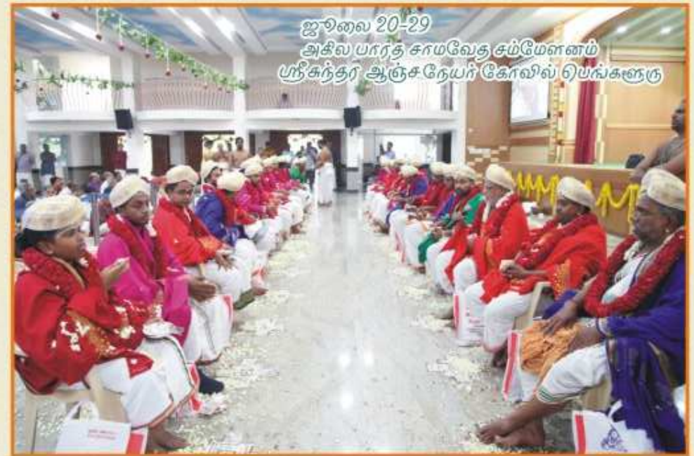
ஜூலை 20-29 அதில பாரத சாமவேத சம்மேளனம் பந்திகந்தர் ஆஞ்சநேயர் கோலில் பெங்களூரு