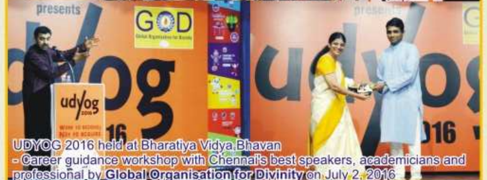
UDYOG 2016 held at Bharatiya Vidya Bhavan - Career guidance workshop with Chennai's best speakers, academicians and professional by Global Organisation for Divinity on July 2, 2016