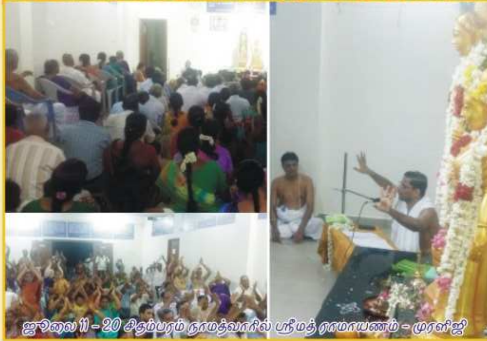
ஜூலை 11 - 20 சிதம்பரம் நாமத்வாரில் ஸ்ரீமத் ராமாயணம் - முரளிஜி