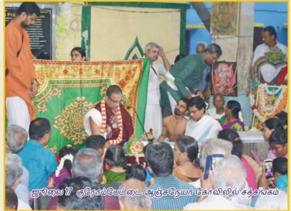
ஜூலை 17 குரோம்பேட்டை ஆஞ்சநேயர் கோவிலில் சத்சங்கம்