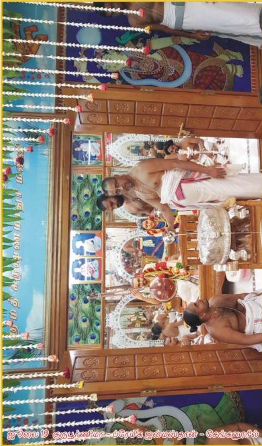
ஜூலை 19 குருபூர்ணிமா - ப்ரேமிக ஜன்மஸ்தான் - கேஸ்குறூரில்