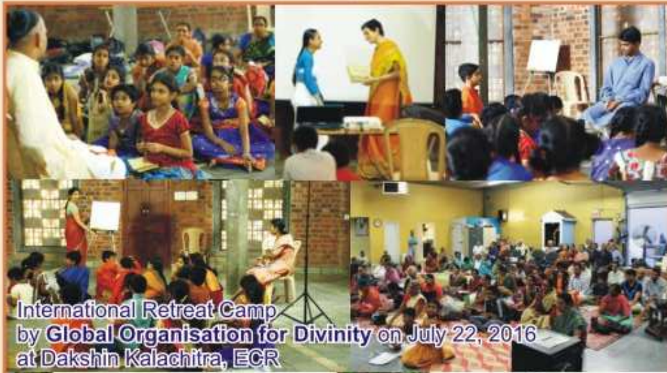
International Retreat Camp by Global Organisation for Divinity on July 22, 2016 at Dakshin Kalachitra, ECR