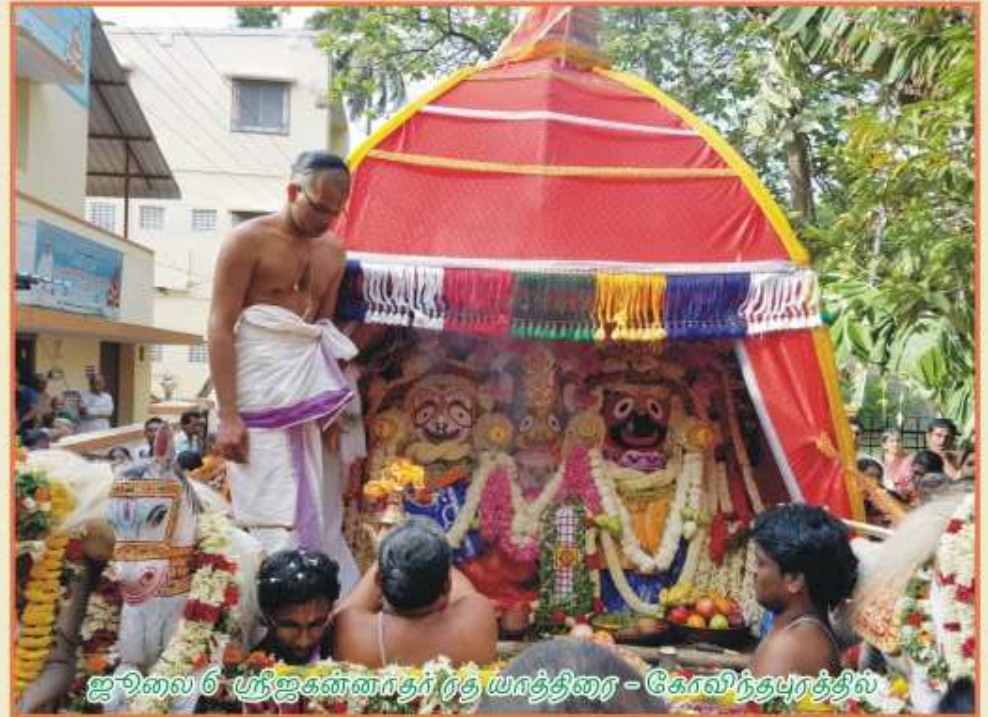
ஜூலை 6 பந்திகண்டாரத்ர யாத்திரை - கோலிந்தபுரத்தில்