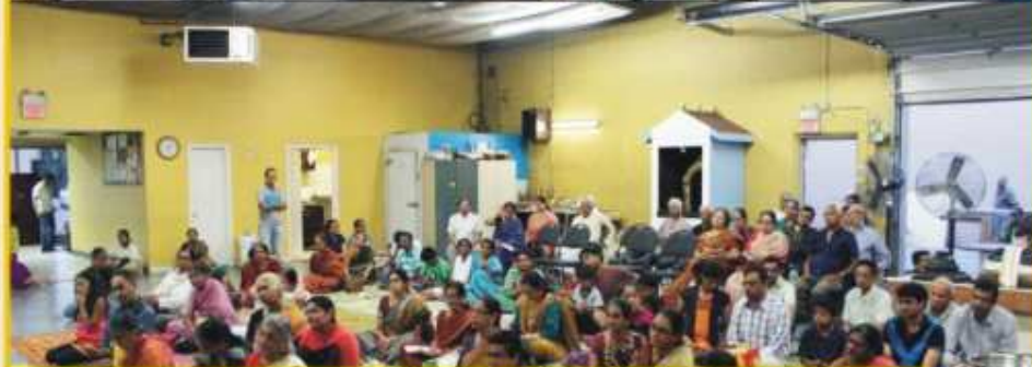
ஜூலை மாதம் - கனடா (டொராண்டோ) மற்றும் (சிகாகோ) அமெரிக்க நாடுகளில் சத்சங்கங்கள் - பூர்ணிமாஜி