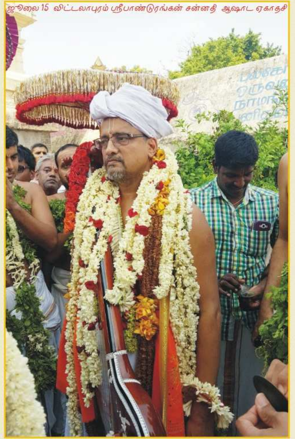
ஜூலை 15 விட்டலாபுரம் ஸ்ரீபாண்டுரங்கன் சன்னதி ஆஷாட ஏகாதசி