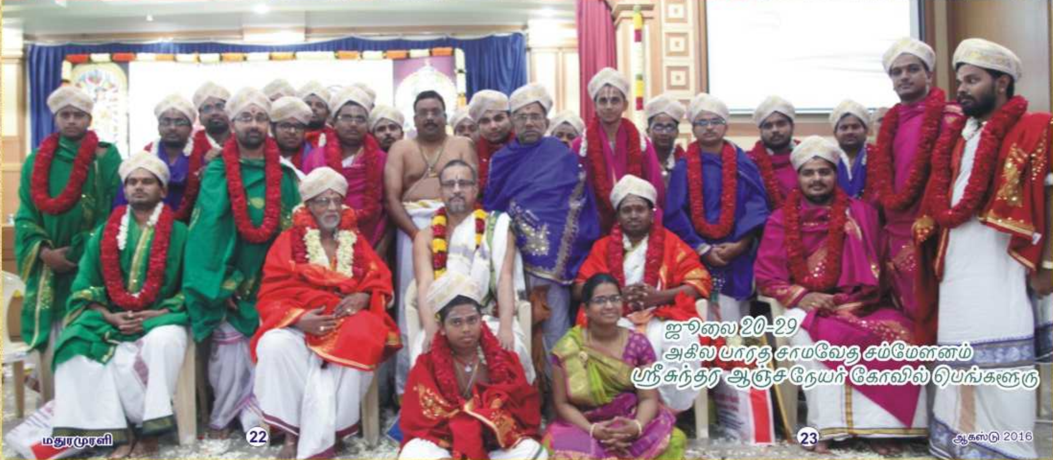
ஜூலை 20-29 அகில பாரத சாமவேத சம்மேளனம் ஸ்ரீகந்தர் ஆஞ்சநேயர் கோவில் பெங்களூர்